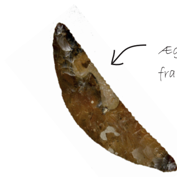
← Ægte kornsegl af flint fra bondestenalderen!