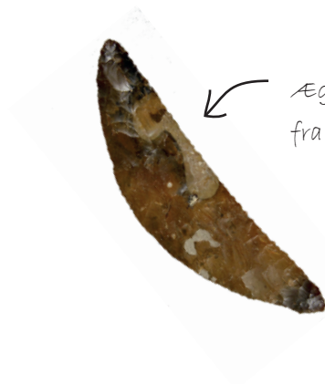
← Ægte kornsegl af flint fra bondestenalderen!